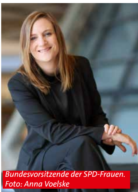
Bundesvorsitzende der SPD-Frauen.

Frauen stellen in Deutschland 50,6 Prozent der Bevölkerung. Im Deutschen Bundestag sitzen aktuell nur 32,4 Prozent Frauen, im Bayerischen Landtag sogar nur 25,1 Prozent. In vielen Stadt- und Gemeinderäten, in Kreistagen und Rathäusern ist das Bild noch düsterer. Männer dominieren die Sitze, die Ausschüsse und vor allem die entscheidenden Positionen. Das ist kein Randphänomen, sondern ein strukturelles Demokratiedefizit. Die Hälfte der Bevölkerung ist in den politischen Entscheidungsorganen systematisch unterrepräsentiert.