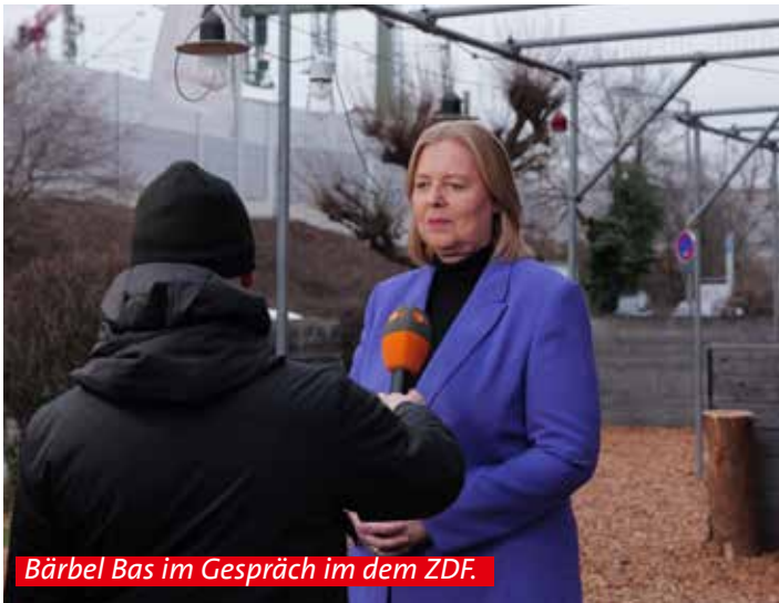
Bärbel Bas im Gespräch im dem ZDF.