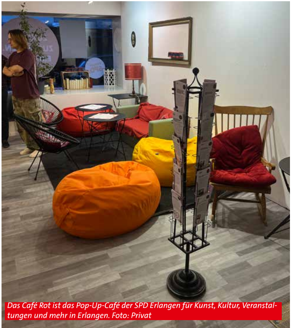
Das Café Rot ist das Pop-Up-Café der SPD Erlangen für Kunst, Kultur, Veranstaltungen und mehr in Erlangen.

Kaffee & Kuchen gibt es auf Spendenbasis – ermöglicht durch das Engagement der backenden und betreuenden Ehrenamtlichen. Eine