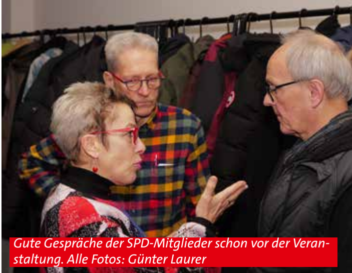
Gute Gespräche der SPD-Mitglieder schon vor der Veranstaltung.