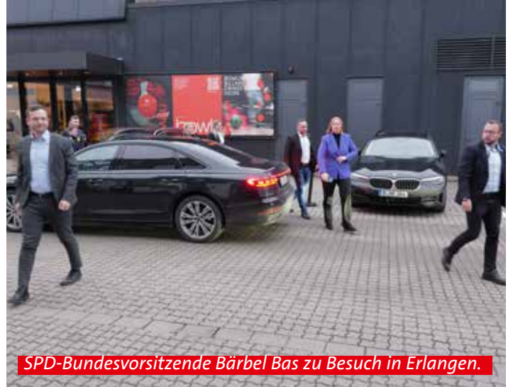
SPD-Bundesvorsitzende Bärbel Bas zu Besuch in Erlangen.