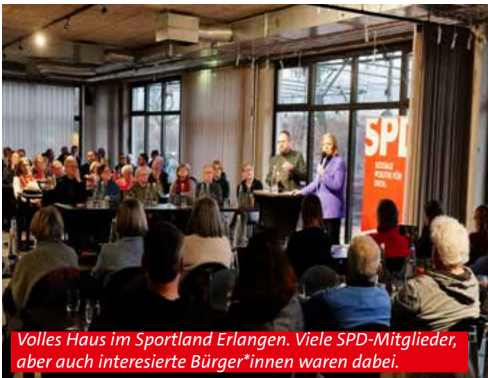
Volles Haus im Sportland Erlangen. Viele SPD-Mitglieder, aber auch interessierte Bürger*innen waren dabei.