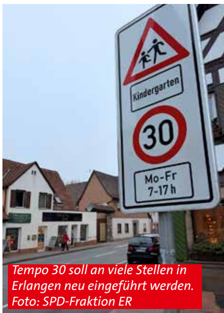
Tempo 30 soll an viele Stellen in Erlangen neu eingeführt werden.

„Die Haushaltskrise lässt uns jedoch nur eine schrittweise Umsetzung zu. Bei den streckenbezogenen 30-Beschränkungen betrifft es überwiegend Schulwege. Hier geht es um Sicherheit und damit um eine Pflichtaufgabe. Diese können zeitnah realisiert werden und haben die höchste Priorität. Ebenso Pflichtaufgabe sind Fußgängerüberwege, die neu errichtet werden und bei denen dann 30 km/h gelten wird. Die Er-