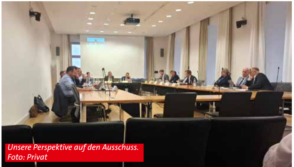
Unsere Perspektive auf den Ausschuss.