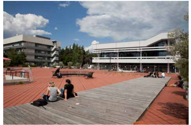
Der „Rote Platz“ im Südgelände

Was bei der Standortsuche wichtig ist Die FAU braucht also für die Technische Fakultät einen zweiten Standort. Dieser